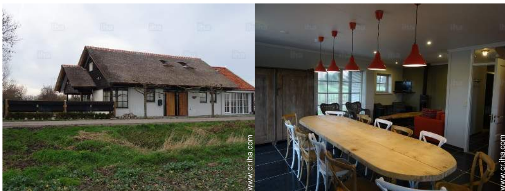
Casa de Lujo