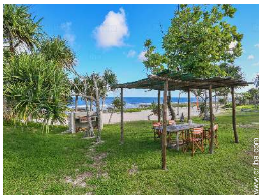
vista desde el jardin/parque