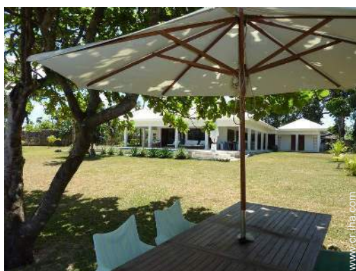
vista desde el jardin/parque