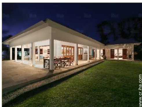
Chalet de Lujo

Privilegios : Acceso directo playa, playa privada, pista helicóptero