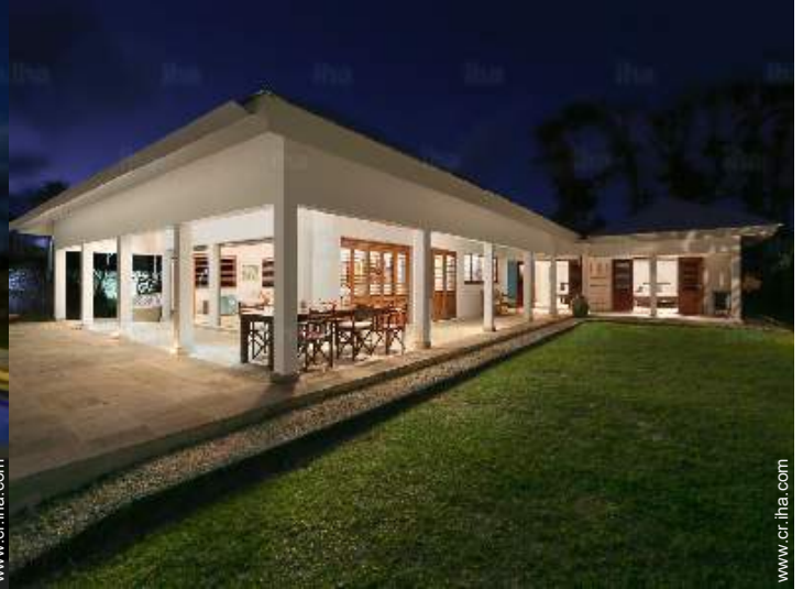
Chalet de Lujo