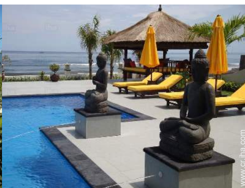
vista sobre el mar