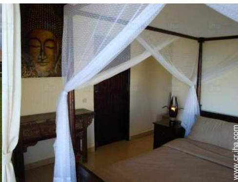
cama(s) de matrimonio(s) con baldaquín