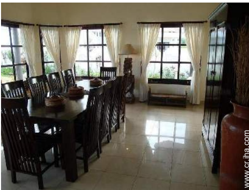
Disposición interior privado