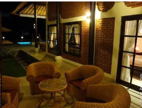
instalación de ocios