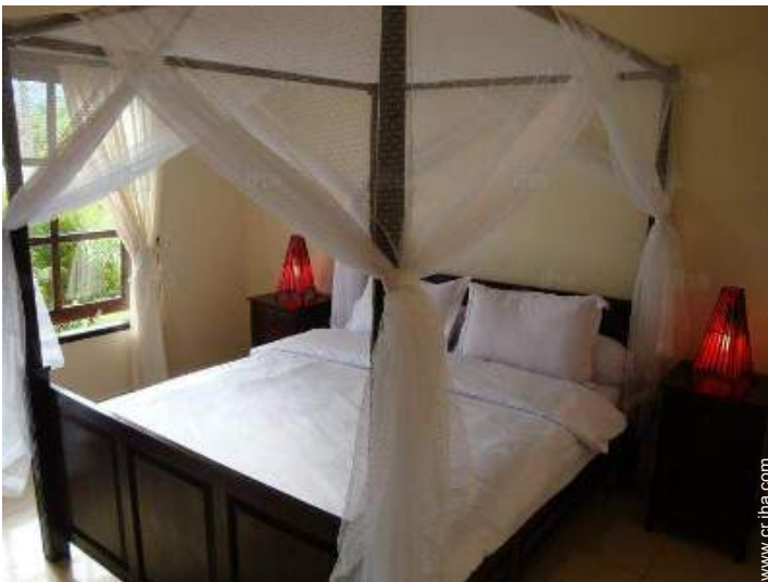
cama(s) de matrimonio(s) con baldaquín