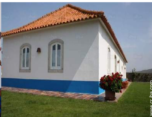
vista sobre el jardin/parque