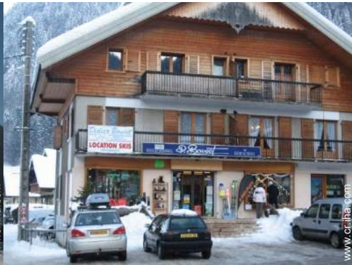
alquiler de equipo de esquí