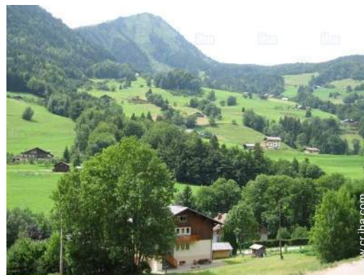
vista sobre la montaña