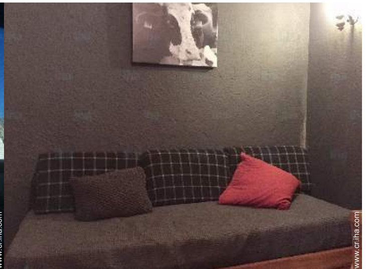
cama nido 1 pers