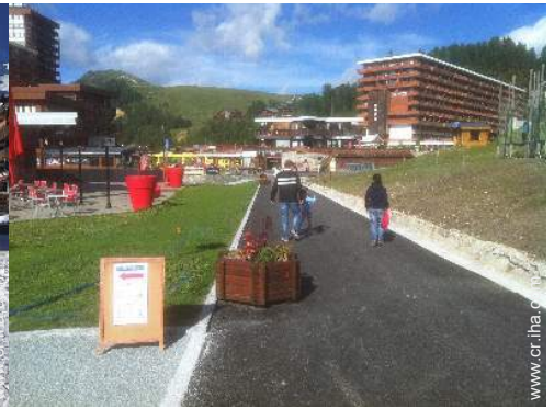
instalación de ocios