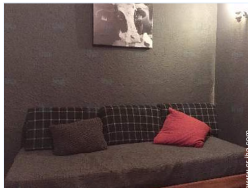
cama nido 1 pers