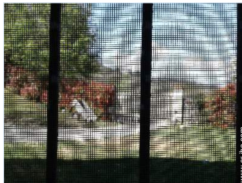
mosquitero de ventanas