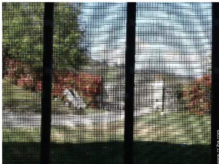
mosquitero de ventanas