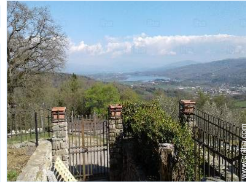
vista sobre el lago

Mesa(s) de jardín, 6 silla(s) de jardín, sombrilla