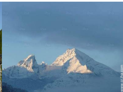
vista sobre la montaña