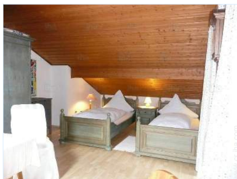
área de descanso