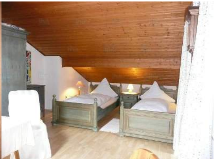
área de descanso