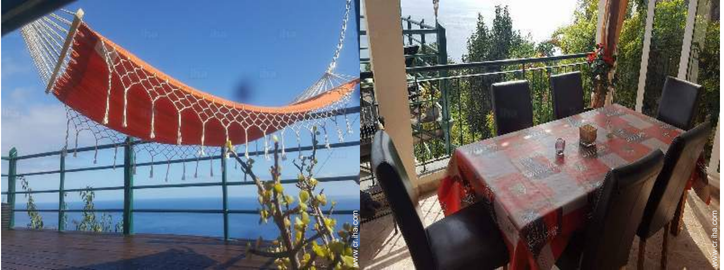
vista desde la veranda