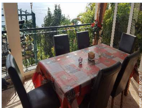
vista desde la veranda