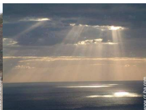
vista sobre la puesta del sol