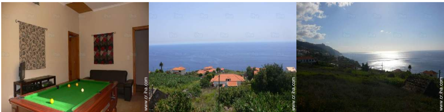
sala de juegos