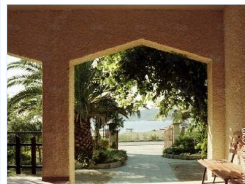
vista desde la terraza cubierta