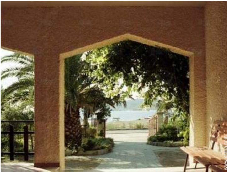
vista desde la terraza cubierta