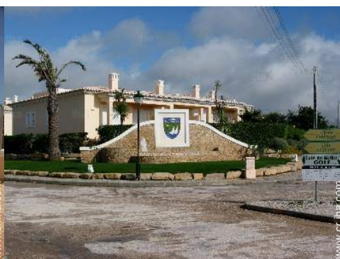
Urbanización de lujo