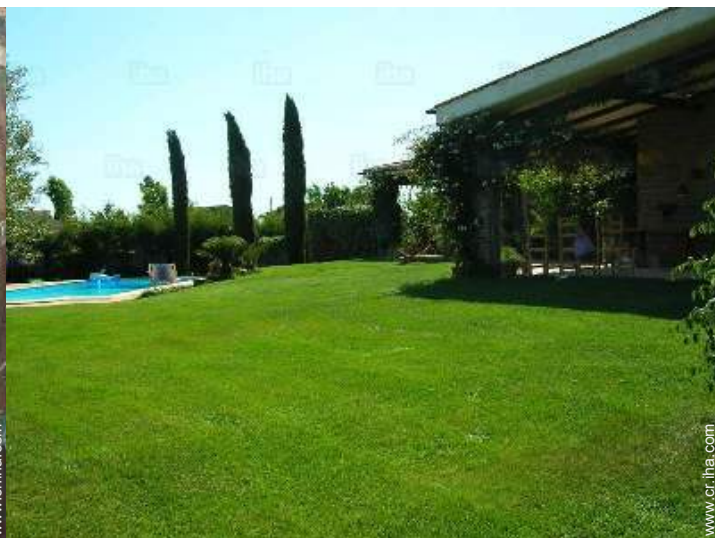
Propiedad con Encanto