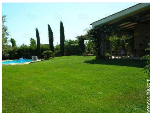
Propiedad con Encanto