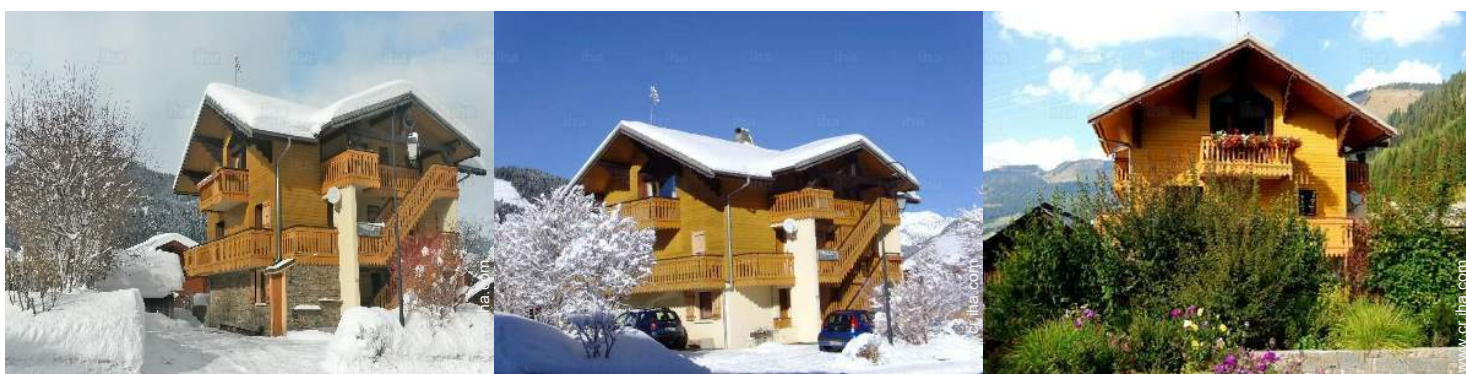
vista de la propiedad