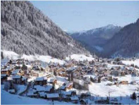
actividades de ocio invernales cercanas