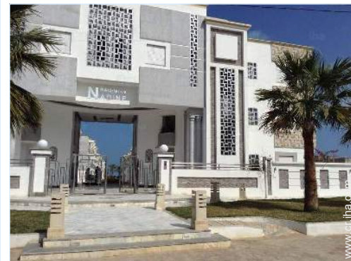
Residencia de lujo