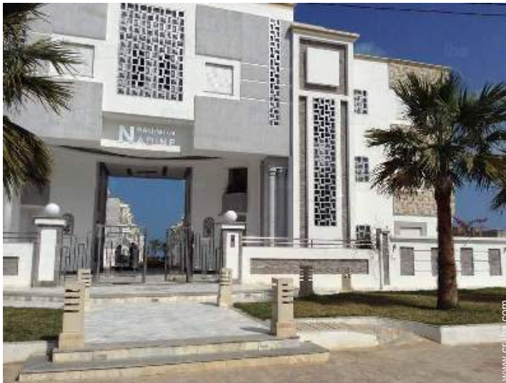
Residencia de lujo