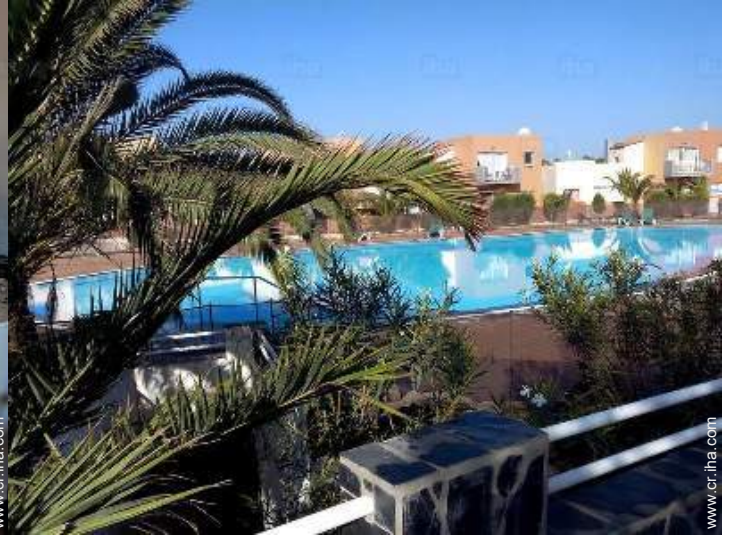
Piscina a desbordamiento