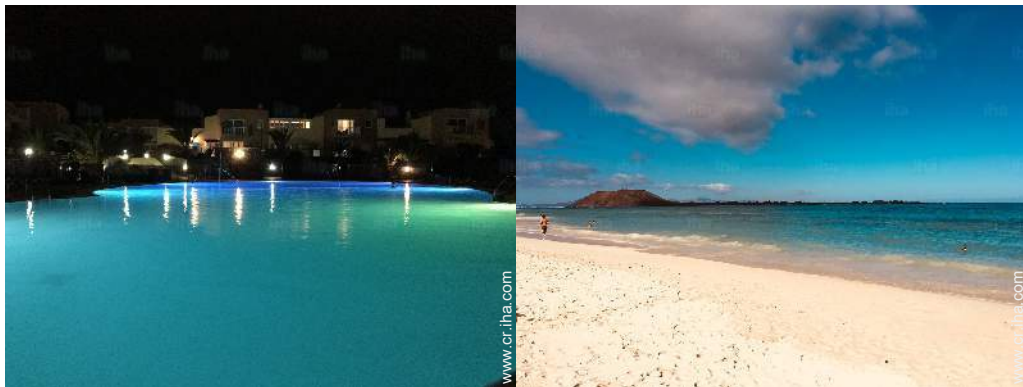
sistema de iluminación