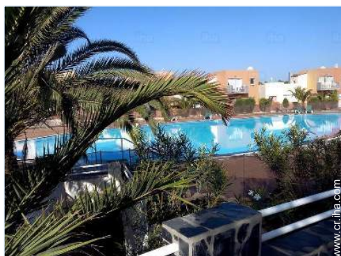
Piscina a desbordamiento