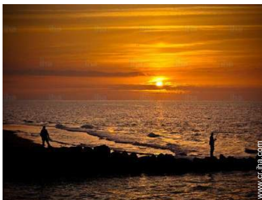
vista sobre el océano