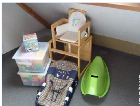
instalaciones de bebé

Acondicionado para disminuidos : auditivo, mental