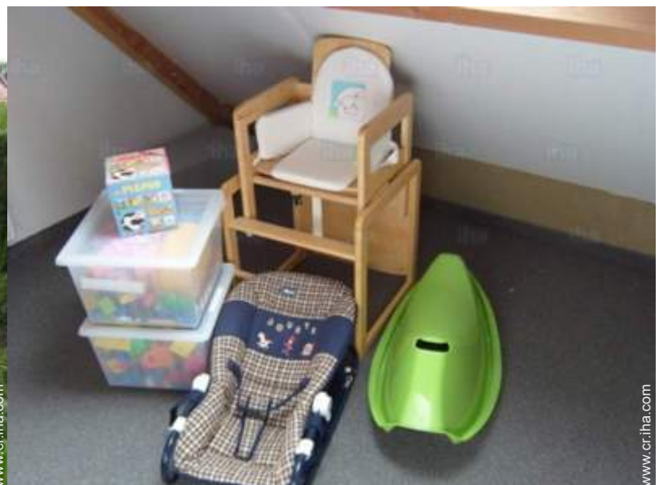
instalaciones de bebé