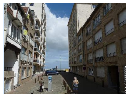
acceso directo playa