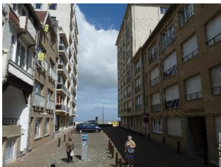
acceso directo playa