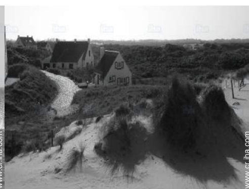
camino para pasear