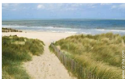
camino para pasear