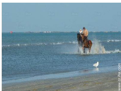
paseo a caballo