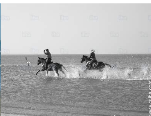
paseo a caballo