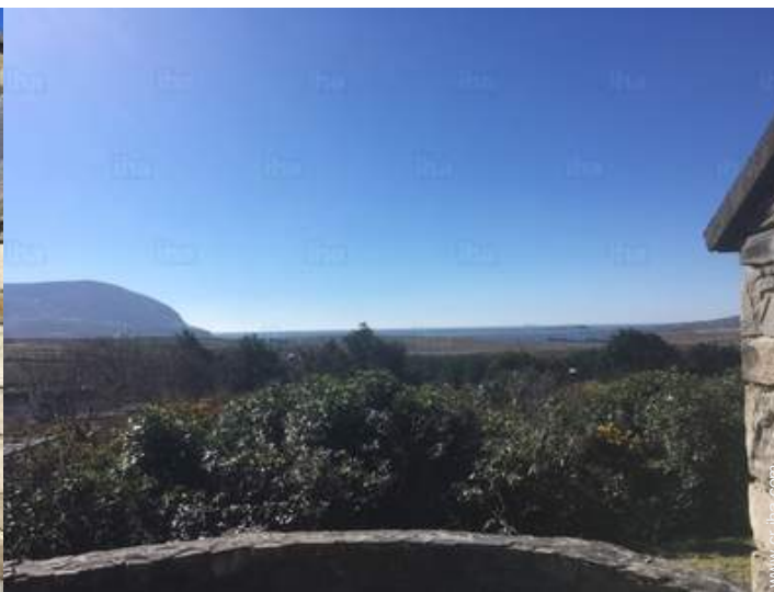
vista desde el patio