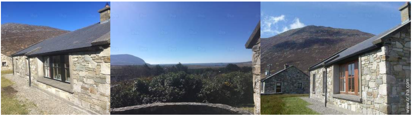
vista desde el patio