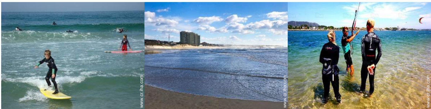
actividades náuticas cercanas