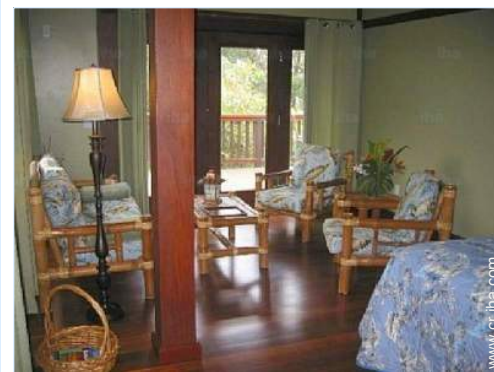
Disposición interior privado

Guardería 2,5km El centro 2,5km Parada/estación de guagua 800m Alquiler de bici/MTB 10km Alquiler de moto/escúter 20km Alquiler de carro 20km Alquiler de barco 7,5km Alquiler de equipo de buceo 7,5km Alquiler de Ropa blanca/lavandería 7,5km Catering 2,5km Pequeños comercios 2,5km Peluquería 2,5km Cibercafé 2,5km Correos 2,5km Banco 7,5km Cajero automático 7,5km Farmacia 2,5km Doctor 2,5km Enfermera 2,5km Hospital 20km Dispensario 7,5km