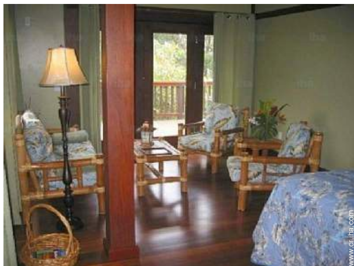
Disposición interior privado