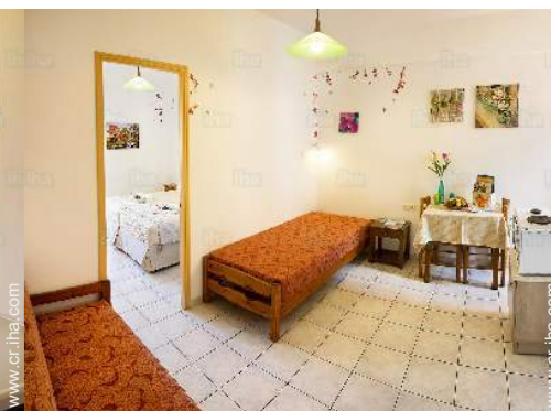
Confort interior e instalaciones