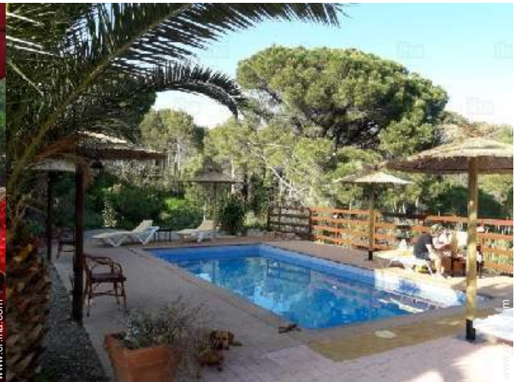
vista sobre el jardin/parque