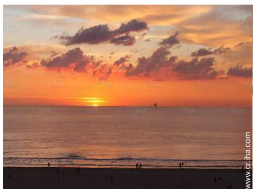
vista sobre la apuesta del sol