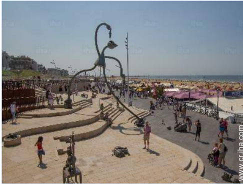
acceso directo playa