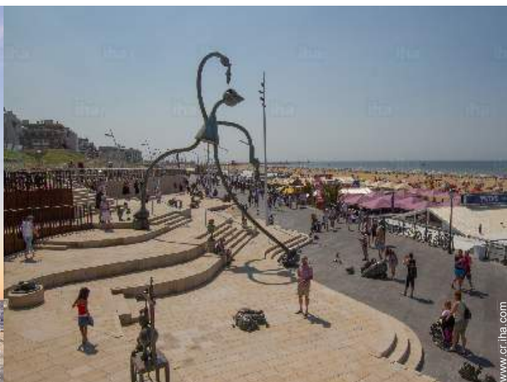
acceso directo playa