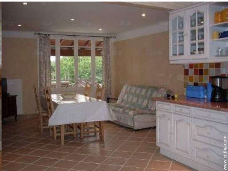
gran cocina americana