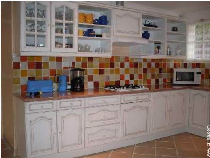
gran cocina americana