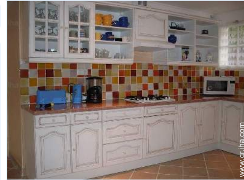
gran cocina americana