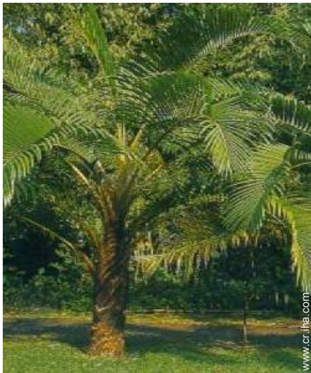
vista sobre el jardin/parque