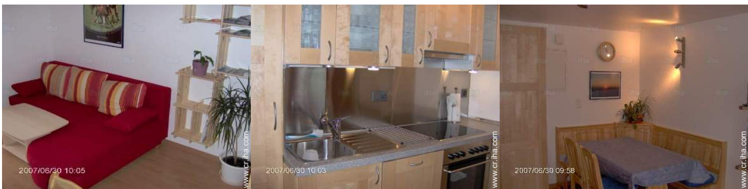
cuarto de estar