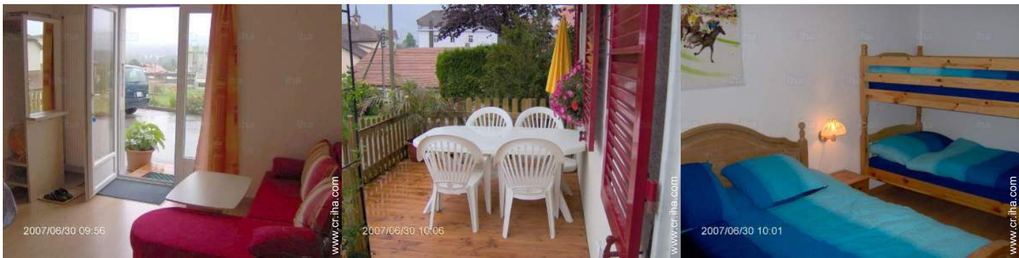
vista desde el cuarto de estar