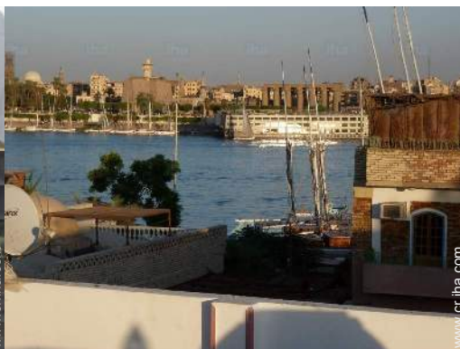
vista desde la azotea