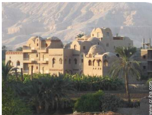
vista desde la azotea