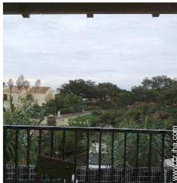
vista desde la terraza cubierta