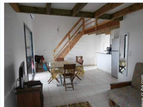
sofá cama 2 pers