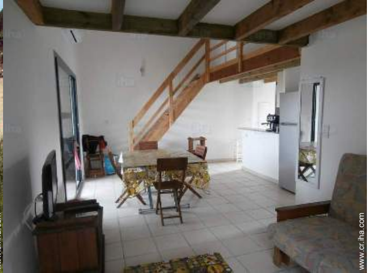
sofá cama 2 pers