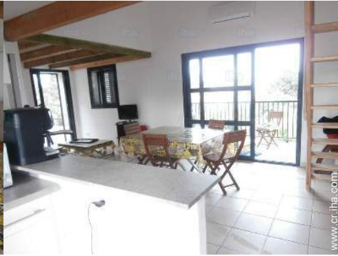
vista desde la cocina