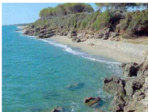
actividades de ocio de verano cercanas