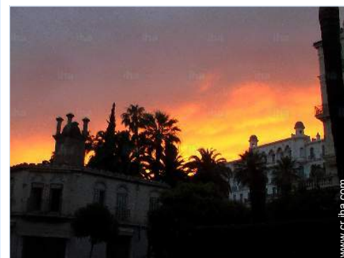
vista de conjunto