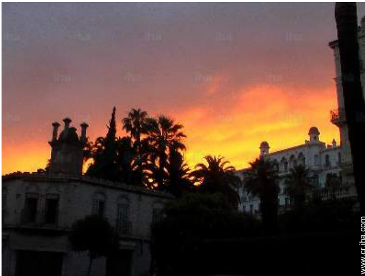
vista de conjunto