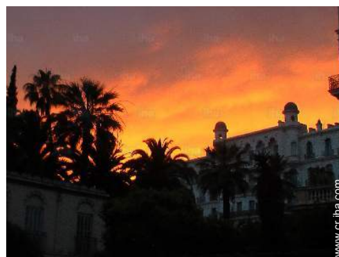
vista de conjunto