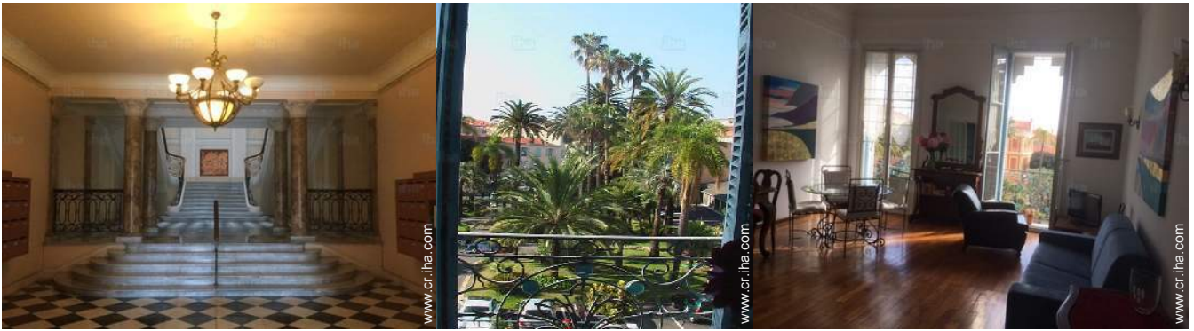
vista de la propiedad