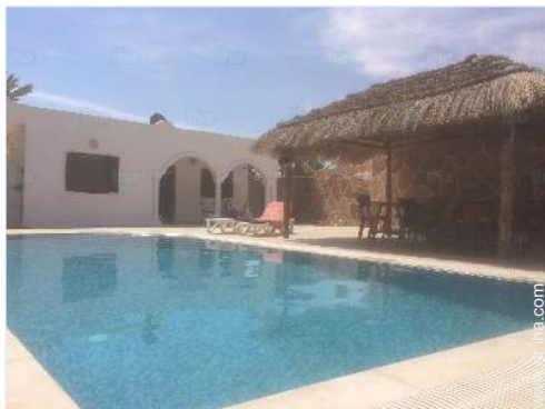
Piscina a desbordamiento