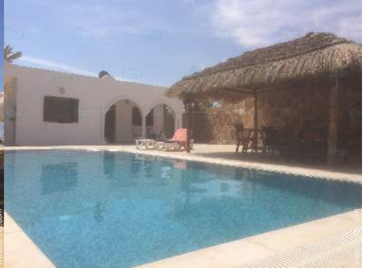
Piscina a desbordamiento