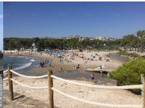
actividades balnearias cercanas