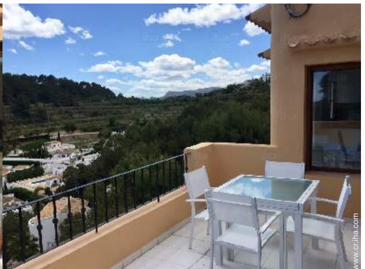
vista sobre la montaña