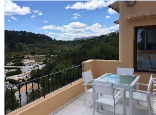
vista sobre la montaña