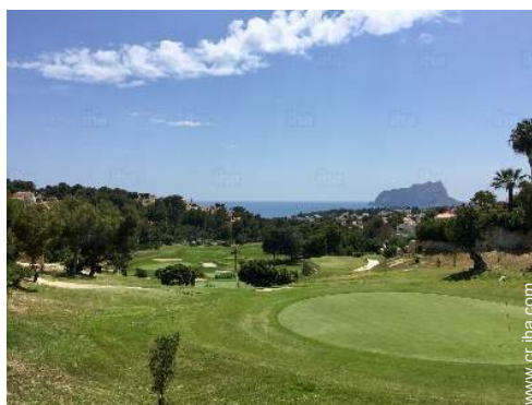
recorrido de golf 9 hoyos