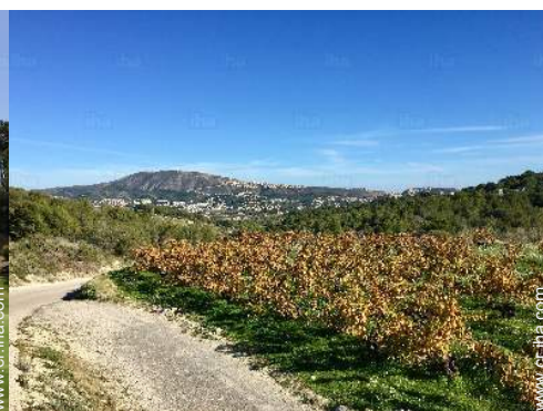
camino para pasear