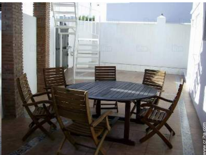
Instalaciones a disposición