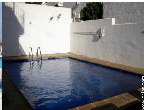
vista desde la piscina