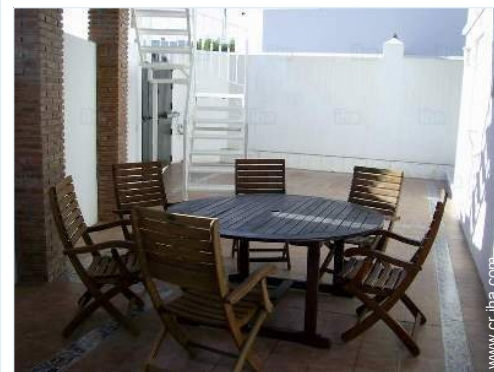
Instalaciones a disposición

Pistas de esquí >50km Playa de guijarro 1,5km Recorrido de golf 18 hoyos 10km Base náutica 3km