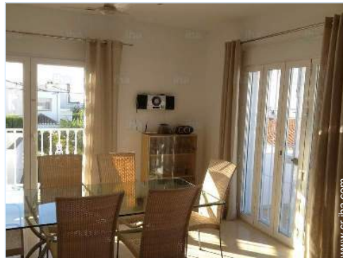
vista desde el salón