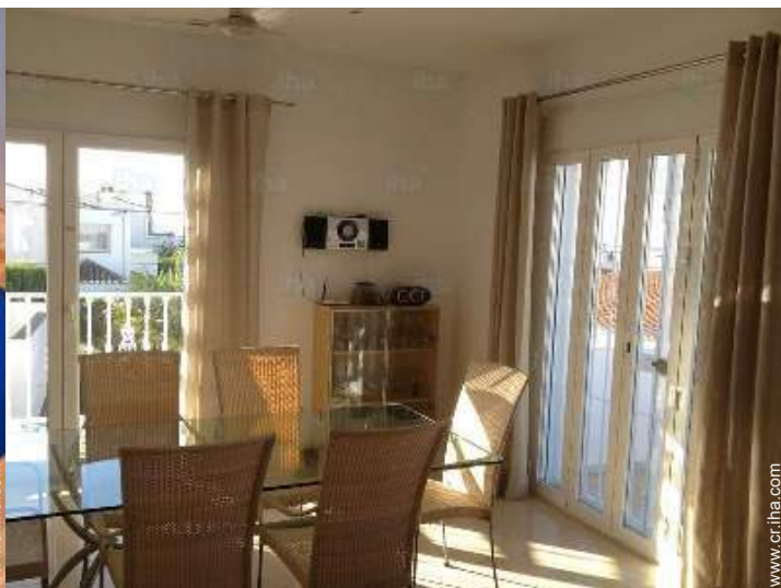
vista desde el salón