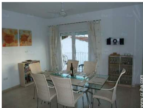
vista desde el cuarto de estar