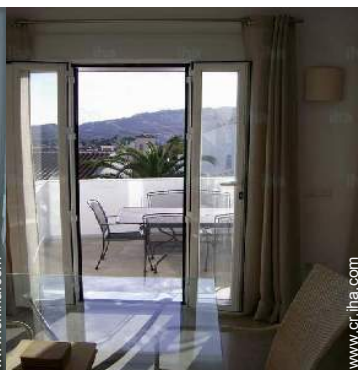
vista desde el cuarto de estar