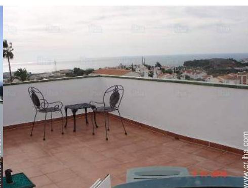
vista desde la azotea