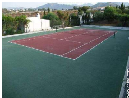
Tenis - superficie sintética