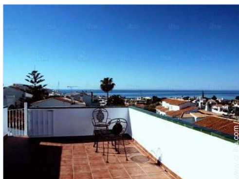
vista sobre las azoteas