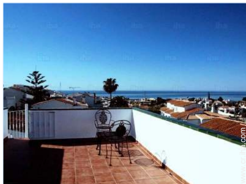
vista sobre las azoteas