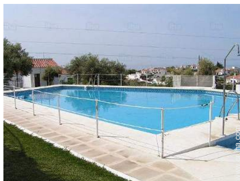
Instalaciones de ocio