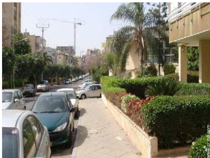
vista sobre la calle/la avenida