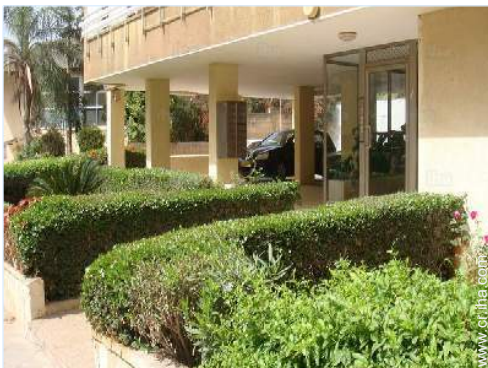
vista sobre la calle/la avenida