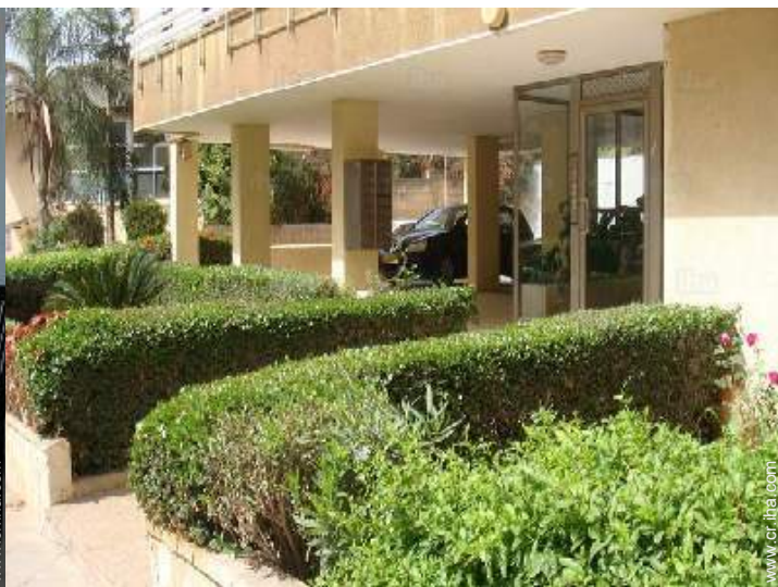
vista sobre la calle/la avenida