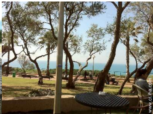
parque y jardin