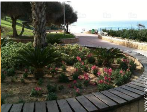
actividades de ocio cercanas