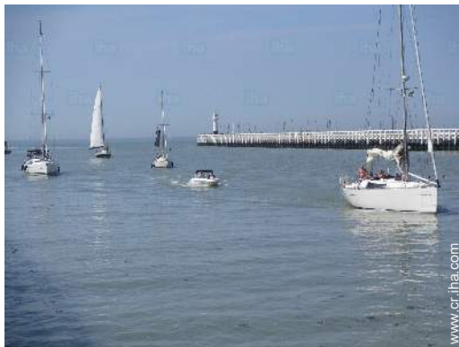
actividades de ocio cercanas