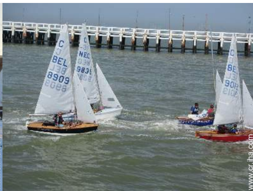
actividades de ocio de verano cercanas