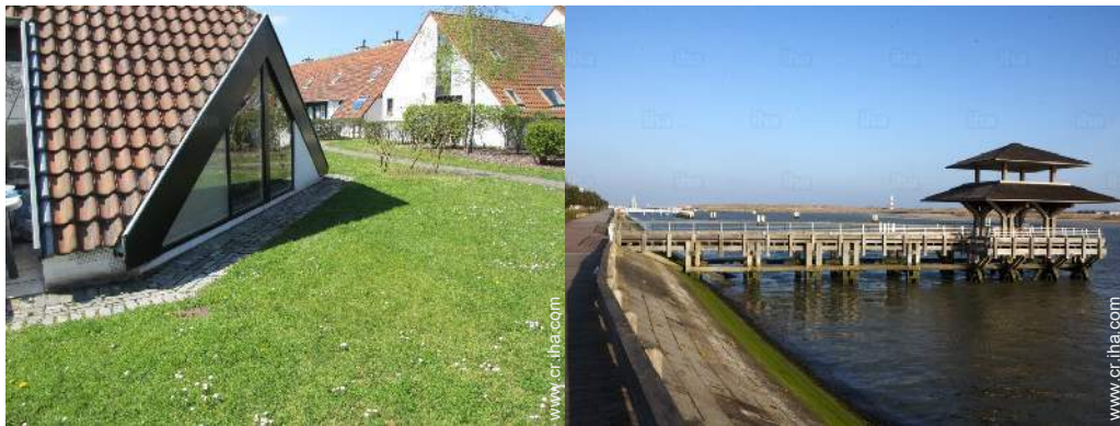
vista sobre el jardín/parque