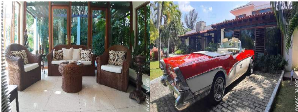
vista desde el salón