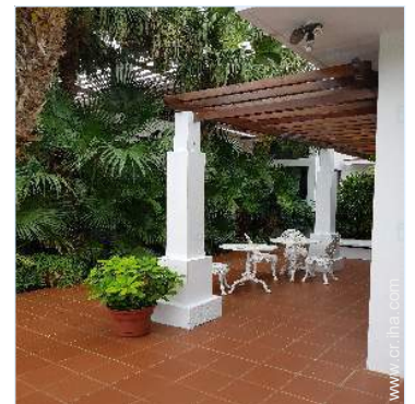
vista desde el patio