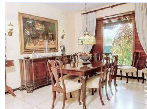
vista desde le comedor