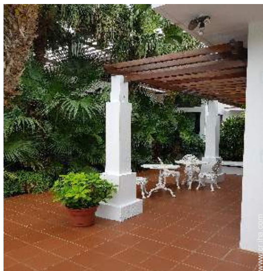
vista desde el patio