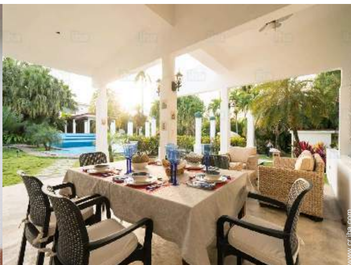
vista desde el jardin/parque