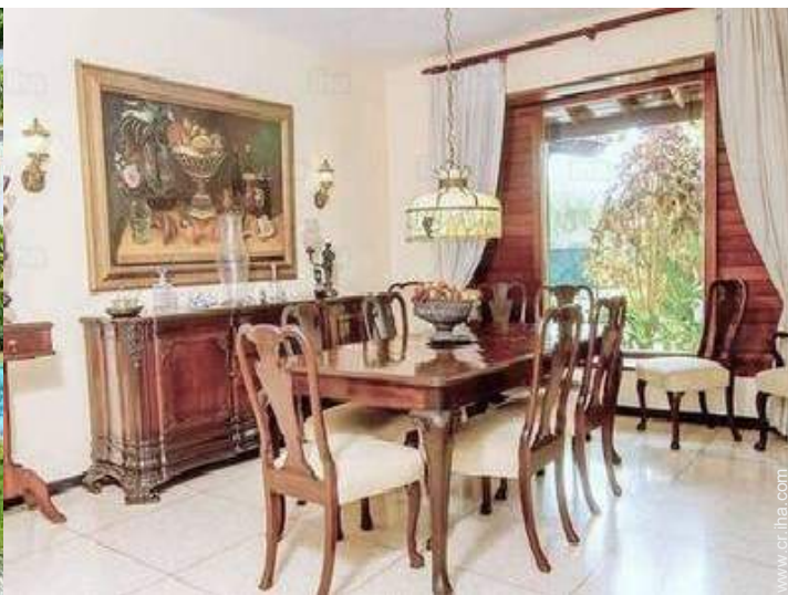
vista desde le comedor