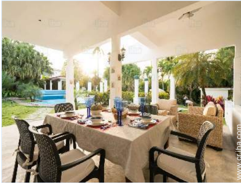
vista desde el jardín/parque