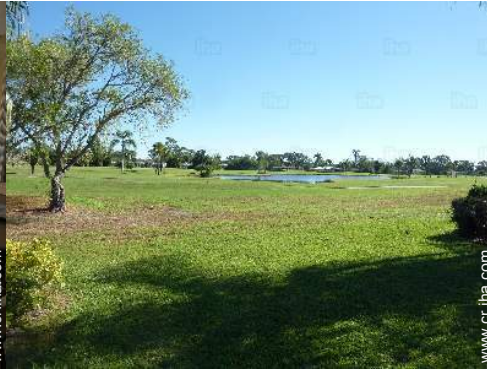
vista sobre el lago