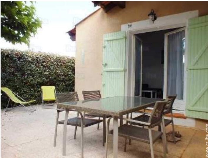
vista sobre el patio