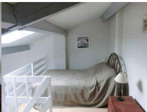
vista desde le entresuelo