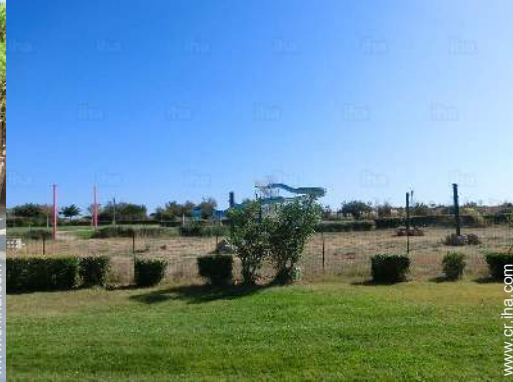
instalación de ocios