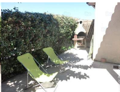
silla(s) de jardín