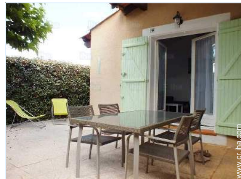
vista sobre el patio