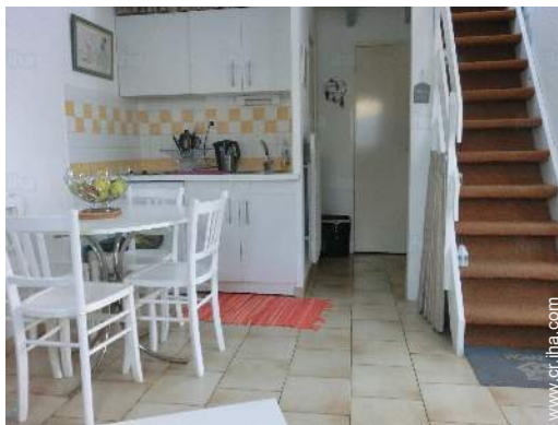
Disposición interior privado