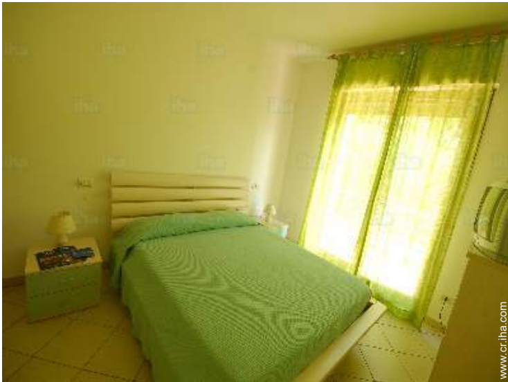
vista desde el dormitorio