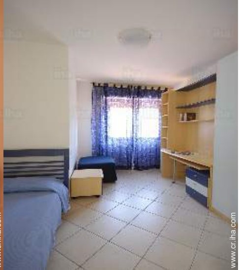
vista desde el dormitorio