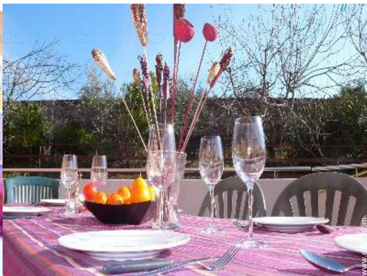
vista desde la terraza