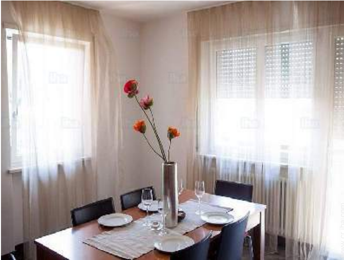
cuarto de estar