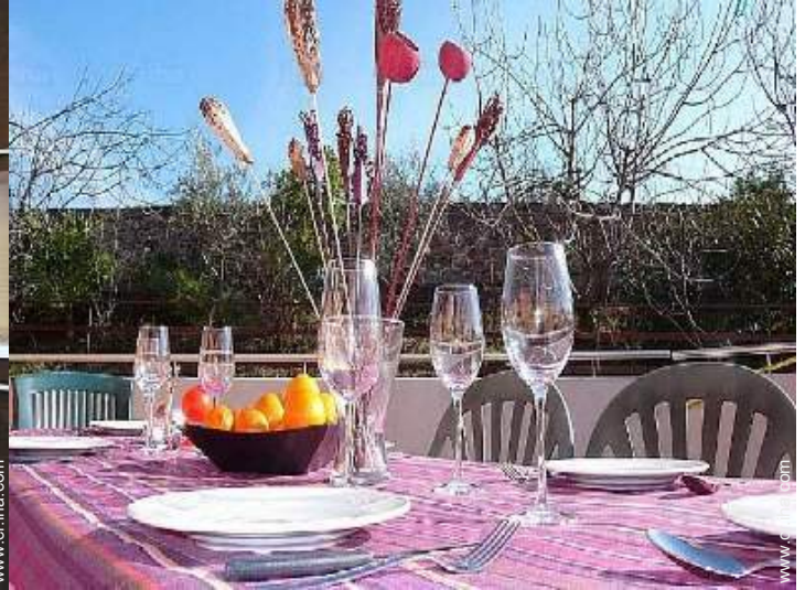
vista desde la terraza