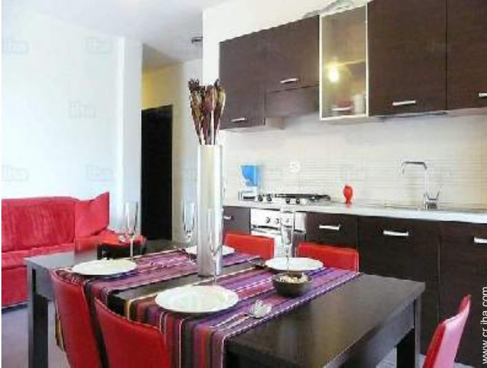
Confort interior e instalaciones