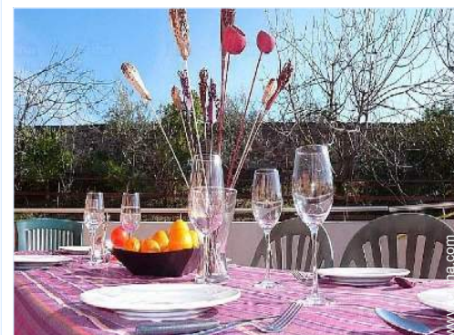
vista desde la terraza