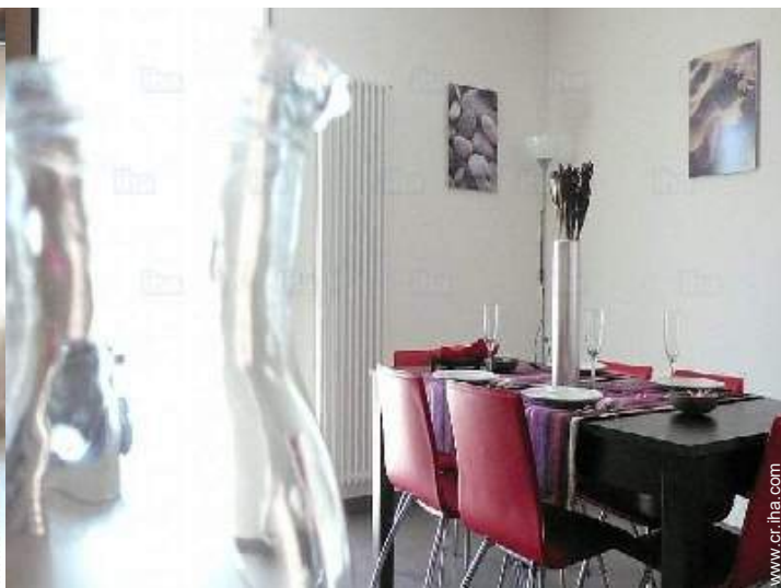
cuarto de estar