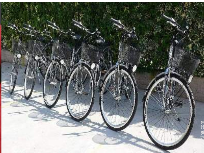
Instalaciones a disposición