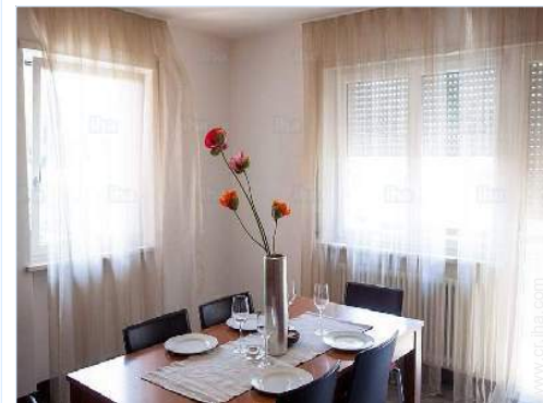
cuarto de estar

El centro 1km Parada/estación de guagua 500m Alquiler de bici/MTB Alquiler de carro 100m Panadería 100m Pequeños comercios 100m Supermercado <50m Peluquería 200m Banco 100m Farmacia 200m