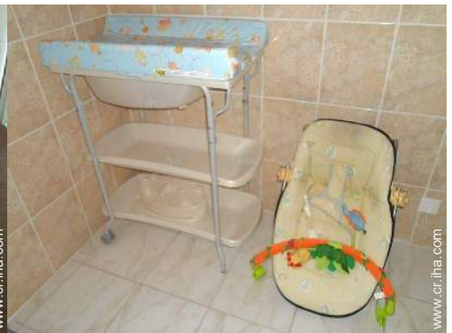
instalaciones de bebé