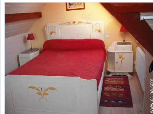
cama de matrimonio

Centro del pueblo 1,5km Parada/estación de guagua 300m Alquiler de bici/MTB 1,5km Panadería 500m Pequeños comercios 1,5km Supermercado 1,5km Peluquería 1,5km Cibercafé 1,5km Correos 1,5km Cajero automático 1,5km Farmacia 1,5km Doctor 1,5km Enfermera 1,5km