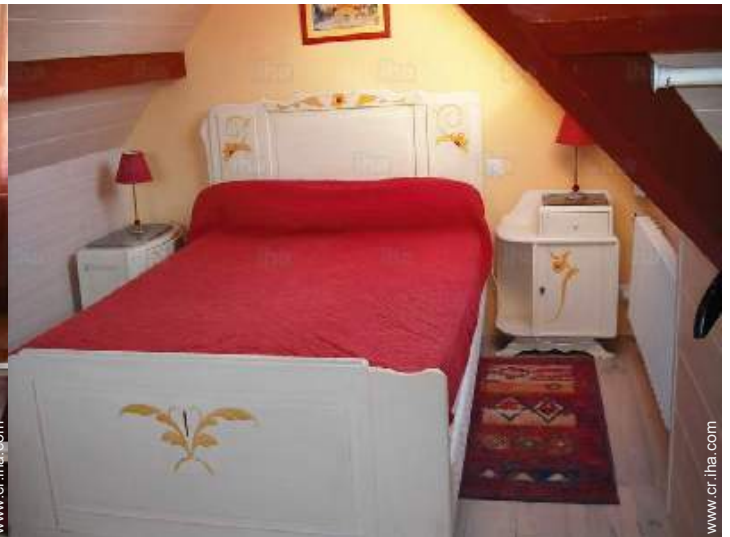
cama de matrimonio