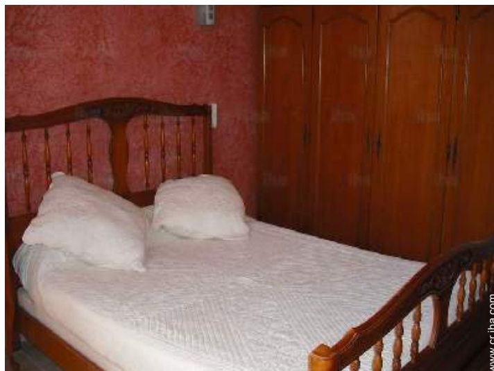
cama de matrimonio