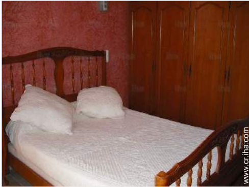
cama de matrimonio