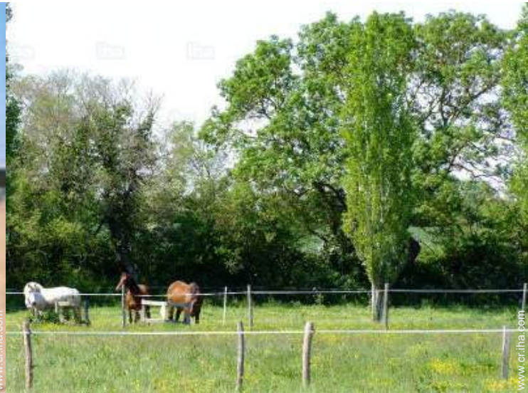
vista sobre pradera