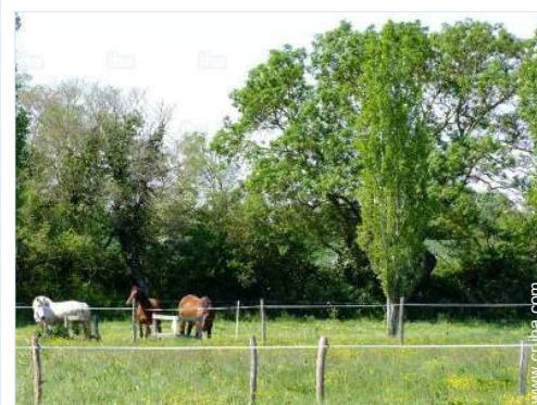
vista sobre pradera

Mar/océano 3km Playa de arena 3km Pista de tenis pública 2km Spot de surf 4km Bosque 1,5km Puerto deportivo 3km Varadero 3km