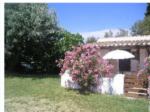
vista de la propiedad