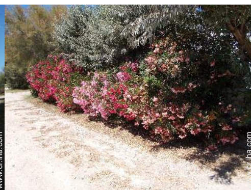
vista de la propiedad