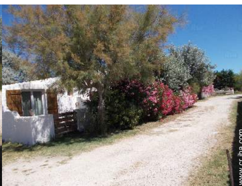
vista de la propiedad