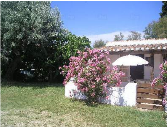
vista de la propiedad