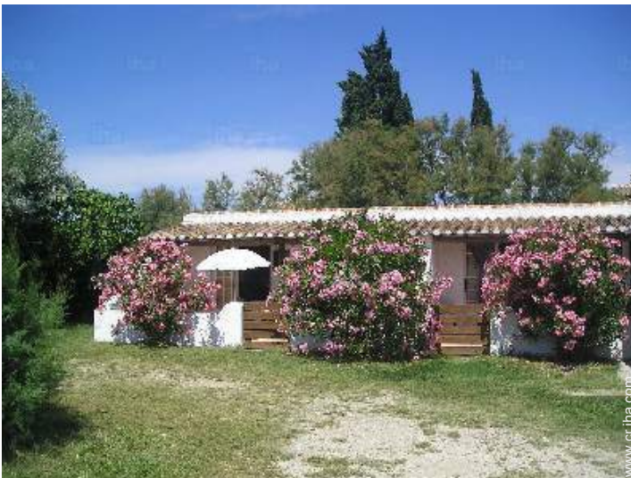
vista de conjunto