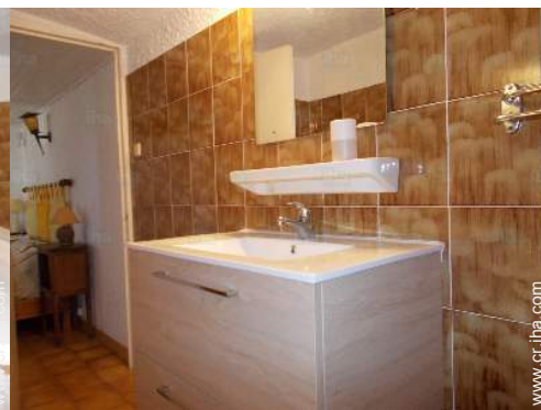
cuarto de baño