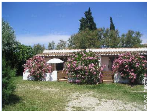
vista de conjunto