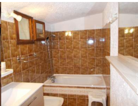
cuarto de baño