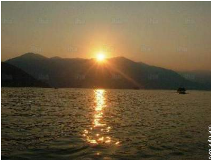
vista sobre la apuesta del sol