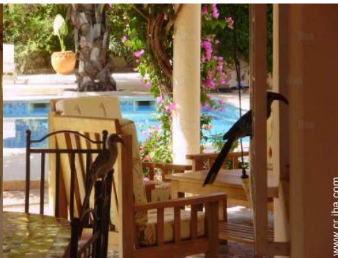
vista desde le comedor