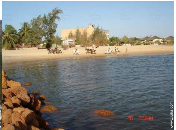
paseo a caballo