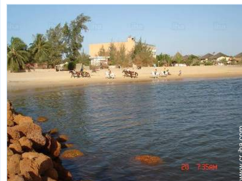
paseo a caballo