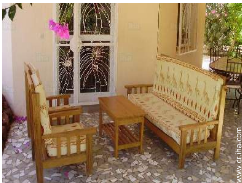
salón de té