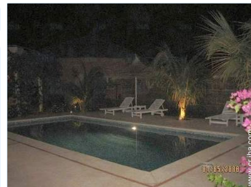
sistema de iluminación

Salón de té, bar exterior, parrilla a gas, mesa (s) de jardín, silla(s) de jardín, cenador, área de jardín, 6 tumbona(s), ducha exterior