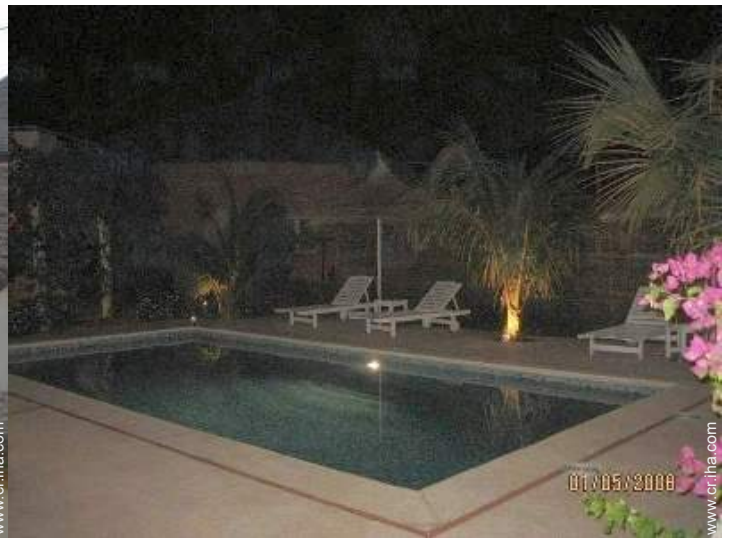
sistema de iluminación