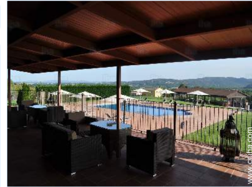
vista desde la terraza cubierta