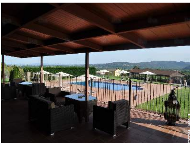
vista desde la terraza cubierta