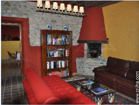
colección de libros