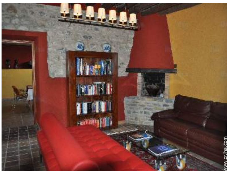
colección de libros