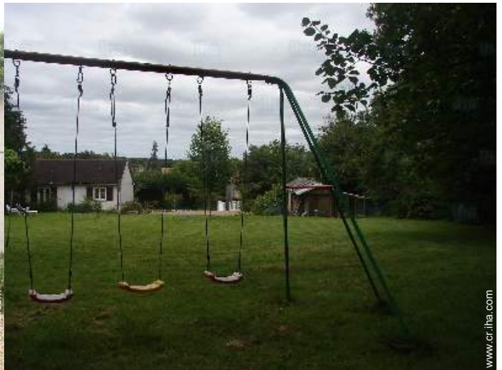
instalación de ocio