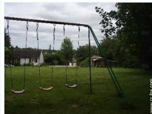
instalación de ocios

Guardería 15km Centro del pueblo 800m Panadería 800m Catering 15km Pequeños comercios 800m Supermercado 10km Peluquería 800m Correos 800m Banco 5km Cajero automático 5km Farmacia 800m Doctor 800m Enfermera 800m Hospital 15km