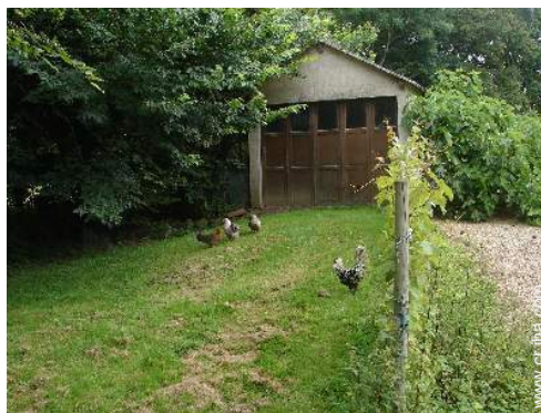
Los animales de la casa