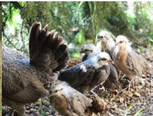
Los animales de la casa