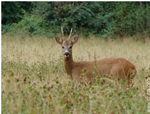
vista sobre el campo