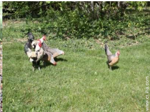
Los animales de la casa