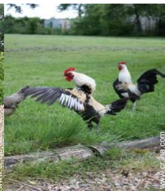
Los animales de la casa