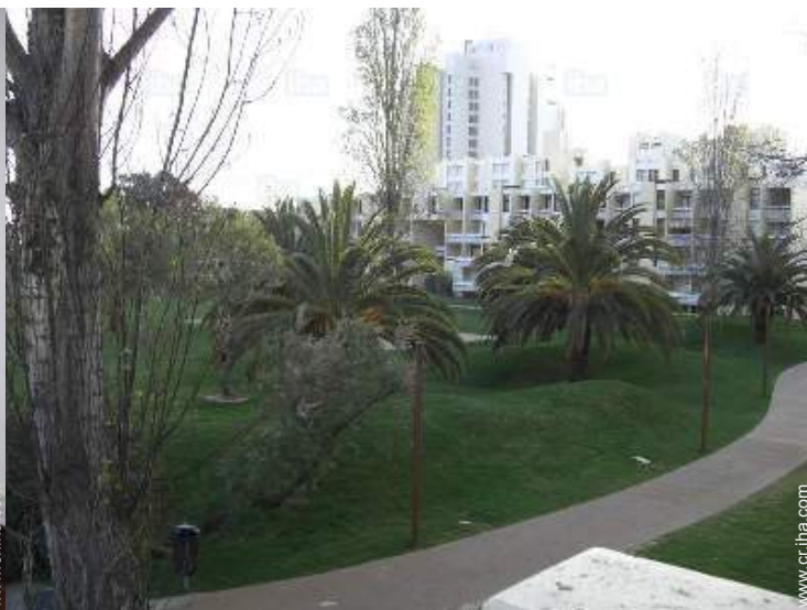
vista desde la veranda