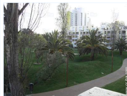
vista desde la veranda

Parada/estación de guagua <50m Panadería <50m Pequeños comercios <50m Supermercado <50m